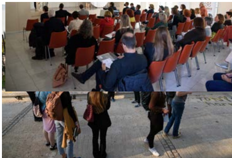
Фотографија: Вођена тура у историјском центру Атине