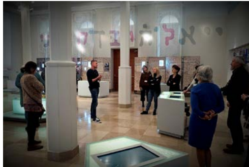
Фотографија: 4. ХАНА семинар у Плогу који је организовао Јеврејски музеј Галиција

Четири семинара је сваки ХАНА партнер организовао у својој земљи да би побољшали знање о локалној јеврејској историји и Холокаусту и повећали свест о антисемитизму, развили иновативне алате против антисемитизма и допринели борби против њега. Више информација о одржаним ХАНА семинарима можете пронаћи овде .