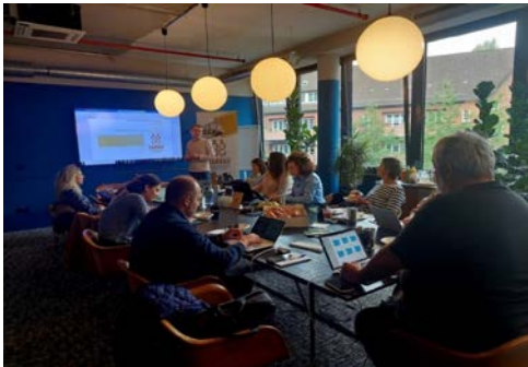
Фотографија: Међународни састанак ХАНА конзорцијума у Хамбургу који је организовала Центропа