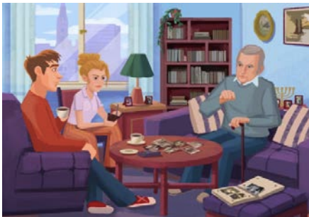
Фотографија: из едукативне графичке новеле

Занима вас како настају историјски едукативни материјали? Прочитајте ХАНА едукативну графичку новелу у којој су детаљно објашњени кораци едукатора и историчара који су истраживали и писали едукативну графичку новелу о Новосадској рацији. Новела је доступна онлајн уз приручник за наставнике, архивисте и библиотекарe са планираним задацима за ученике. Сав материјал је доступан на немачком, пољском, српском, грчком и енглеском.